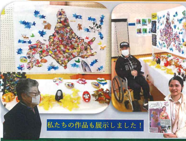
私たちの作品も展示しました!

日中活動で制作した作品や利用者様が余暇時間に制作した作品を今年度も文化祭に出展する事が出来ました。コロナウイルスの感染症対策の為、今年も作品を出展された利用者様のみのお見学となりました。