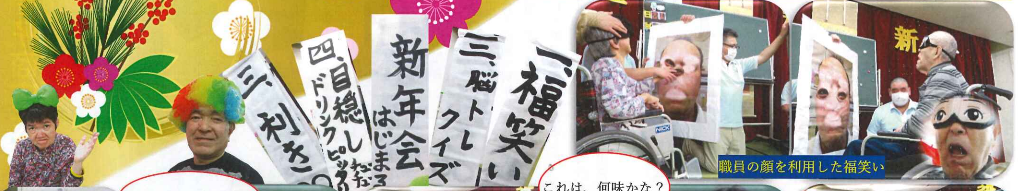
職員顔を利用した福笑い