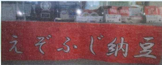
ご利用者が作ったちぎり絵の看板

このイラストは絵を描く事を趣味にされている方の作品。道具も自分の物を使用したいと、こだわりながら描いた力作。今後は、パソコンの入力作業や清掃、調理作業等自分の得意な事、興味のある事にも目を向けて作業提供をしていく予定です。