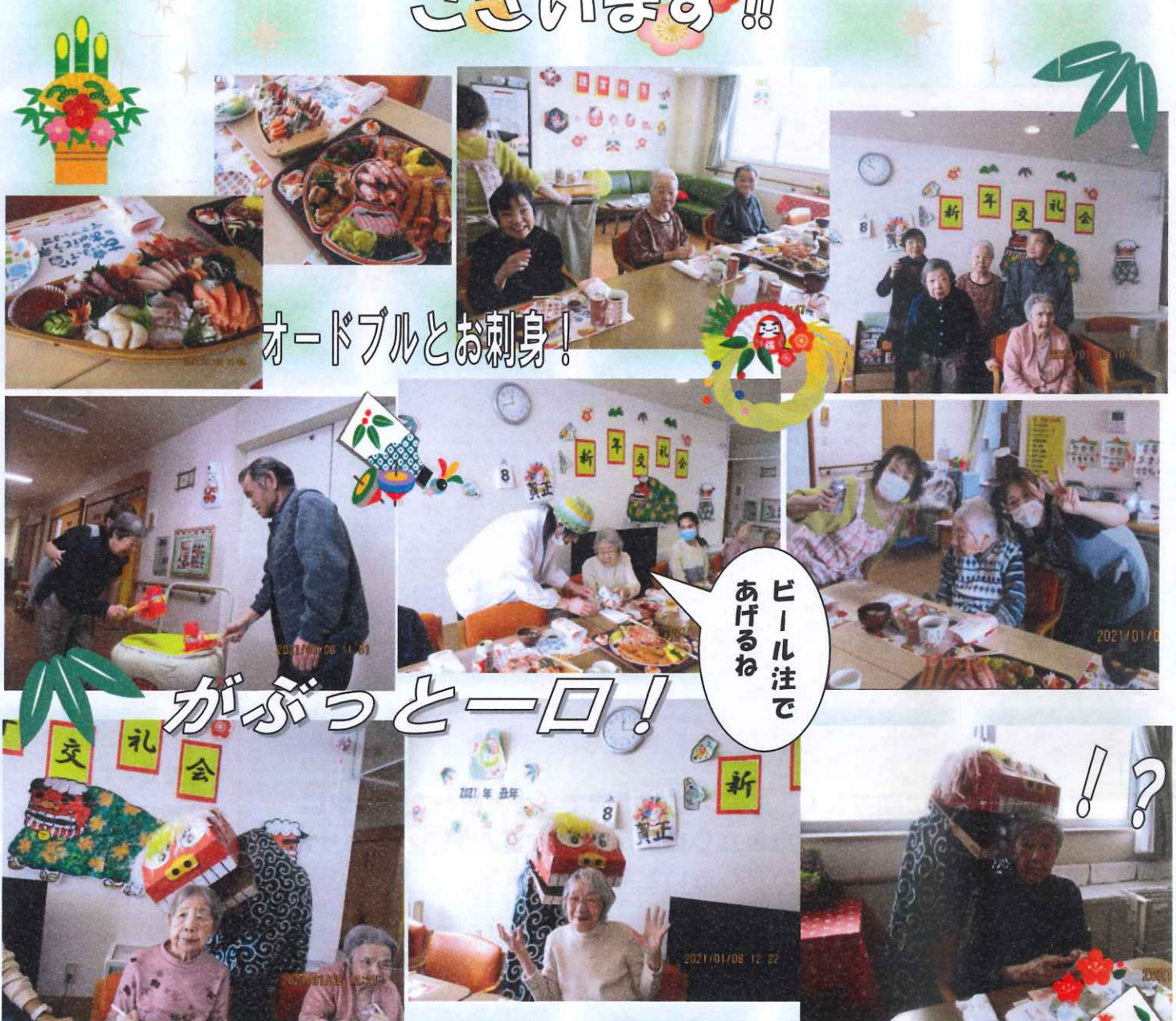
オードブルとお刺身！