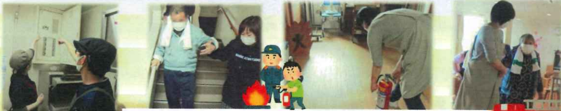
3月17日、複合施設の避難訓練を行いました!!!

いつも大変お世話になっております。令和3年4月1日から介護保険報酬額の改正が施行されます。つくしんぼ利用者さまには直接説明に伺わせていただきます。何卒ご理解、ご協力、よろしくお願い致します。