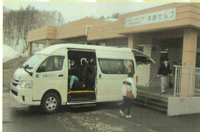
送迎ワゴンもリニューアル