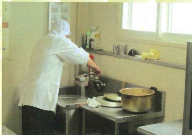
簡単な調理作業もする事になりました。

利用者が地域や事業所外で活躍できる場の一つとも捉え、「地域貢献ができる」「地域住民として役割を持つ」機会とし積極的に実践していきます。