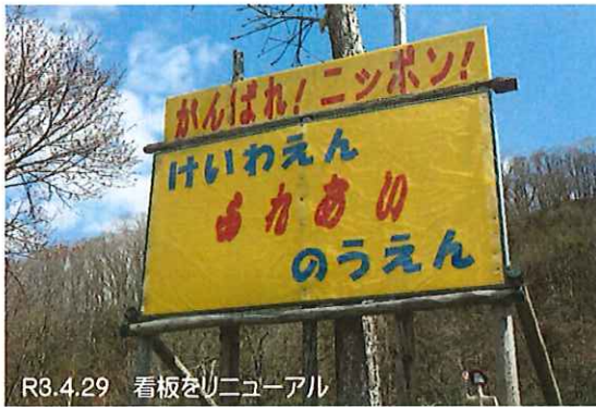
R3.4.29 看板をリニューアル

一昨年（2019年）の年末より世界的に感染拡大が始まった「コロナ禍」、長く影響が広がる中での活動となりますが十分に感染予防策