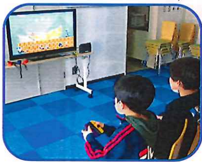
ゲームを楽しむ子ども達