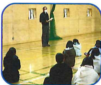
今年初めての集会