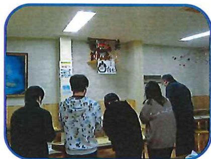
としとり前に受験生が神棚にお参り

当園での年末年始の過ごし方や行事についてご紹介します。 12月26日～1月9日まで冬休みの一時帰省を行いました。昨年度は12月に職員が新型コロナウイルスに感染したこともあり、一時帰省を見合わせましたが、今年度については感染状況が落ち着いてきたこともあり実施いたしました。 一方、27日の『もちつき』は中止とし、調理員が作ったおもちをその日の昼食で食べました。 29日作った『まゆ玉飾り』を玄関と食堂に飾りました。 30日の『としとり』では、豪華な夕食を食べながら一年を振り返りました。 年が明けて1月1日はおせち料理が食卓に上がりお正月気分を味わいました。午後に行われた、今年初めての集会では岡久施設長から部屋ごとにお年玉が手渡され、子ども達は