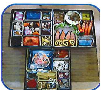
豪華なおせち料理

大喜びでした。また、マスク着用や消毒など感染予防についてもお話がありその後、大鳥神社に初詣に行きました。 翌2日には『書初め』が玄関ホールで行われました。(本誌記事参照) その他にもクリスマスに寄贈された『DVDの鑑賞会』を開催したり、12月30日～1月5日には子ども達が楽しみにしていたテレビゲームの専用部屋が男女棟に用意され、みんなで仲良く遊んでいました。 12月31日～1月3日は就寝時間が決められておらず、遅くまでテレビやゲームをして遊んでいた一方、12月31日～1月5日以外は一時間の学習時間が設定され、冬休みの宿題に頑張っており組みました。 当園でお正月を過ごした子ども達の外出は男女別・学年別に分かれて行われました。それぞれのグループは函館や室蘭、伊達で買い物をしたり、レジャー施設で楽しい時間を過ごしました。