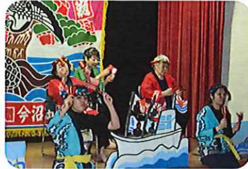
練習からとても楽しかったです。リズムが早いけど上手に出来ました。大満足です!!