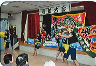
活みなぎるソーラン節でした。カッコ良かった～