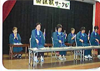
今年もコロナで先生は来られなかったけど、皆頑張りました。