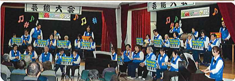
いよいよ本番。大トリです。練習の甲斐あり、バッチリでした!