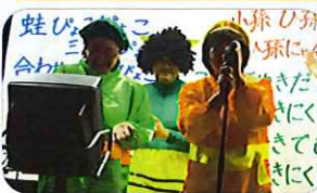
職員余興。つりまに負けないで頑張りました。