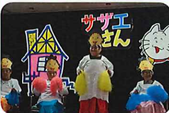
練習も本番も皆サザエさんになりきり頑張りました。