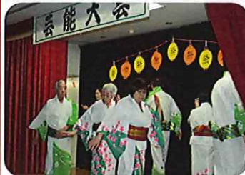
今年は桜の浴衣で踊りました。春が待ち遠しいですね。