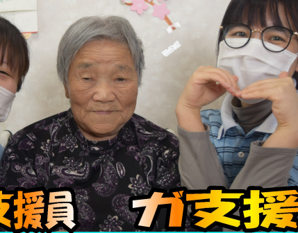
平沼副主任支援員