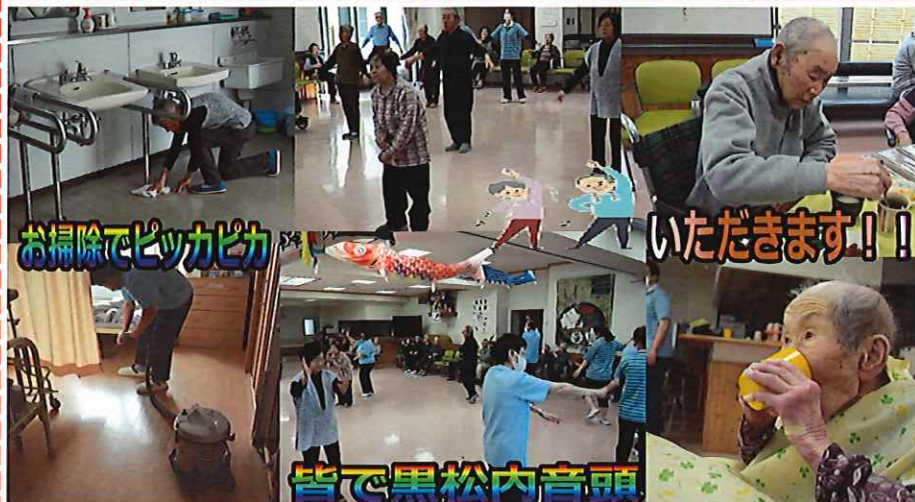
お掃除でピッカピカ