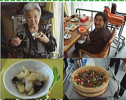
ご飯食べて元気100倍!!

この日の昼食は、旬の食材を使った、どの酢味噌和えでした。食からも季節を感じます。また、端午の節句には、ちらし寿司ができました。こちらにも、季節の味を感じることができました。午後、体操はタオルを使ったリズム体操。曲に合わせて身体を動かしています。耳馴染みのある曲ですから、身体を動かしてもいいですね。口ずさんだりも、おなじみの曲です。おやつタイムは、日替わりで入浴タイムにしたい。また、お部屋でくつろぐ方もいれば、お隣様やお友達との部屋でしゃべりを楽しむ姿も見られます。楽しみ方は十人十色。皆さん自分の時間を過ごし、ゆったりとした午後を過ごしています。