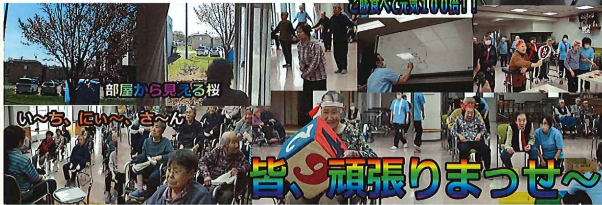
部屋から見える桜