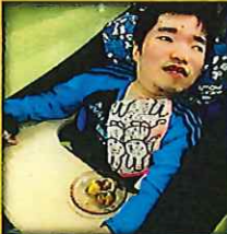
喫茶店にてタコ焼きをしました。手作りのタコ焼きを利用者の皆様、「美味しい」と話しながら食されていました😊