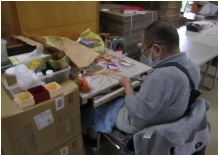
前月号でご紹介したクラフトテープで 製品づくりをするご利用者様。

前月号に紹介した作業の中から、クラフトテープを使って小物入れやティッシュケースなど販売しております。