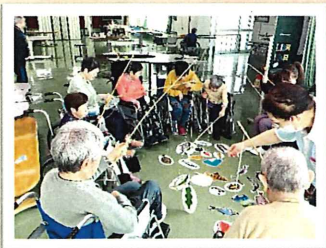
さかな釣りゲーム 🎣