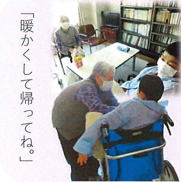
「暖かくして帰ってね。」

5月7日、訪問販 売がありました。 写真でお伝え出来 れば良いのですが、 沢山の衣類・タオル 等が並べられてお り、貸し切りショッ ピングのようなイメ ージです。 生地の肌触りやサ イズを見ながら「こ れどうかな？」と相 談し買い物出来るの も訪問販売の醍醐味 です。 利用者さん自ら 商品を手に取り、気 に入った物を見つけ ては、多くの衣類を 購入されました。