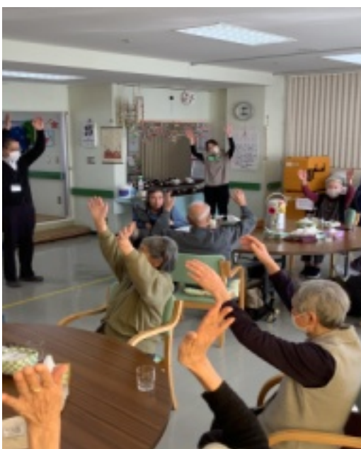
最後には、万歳三唱でお祝いを締めました