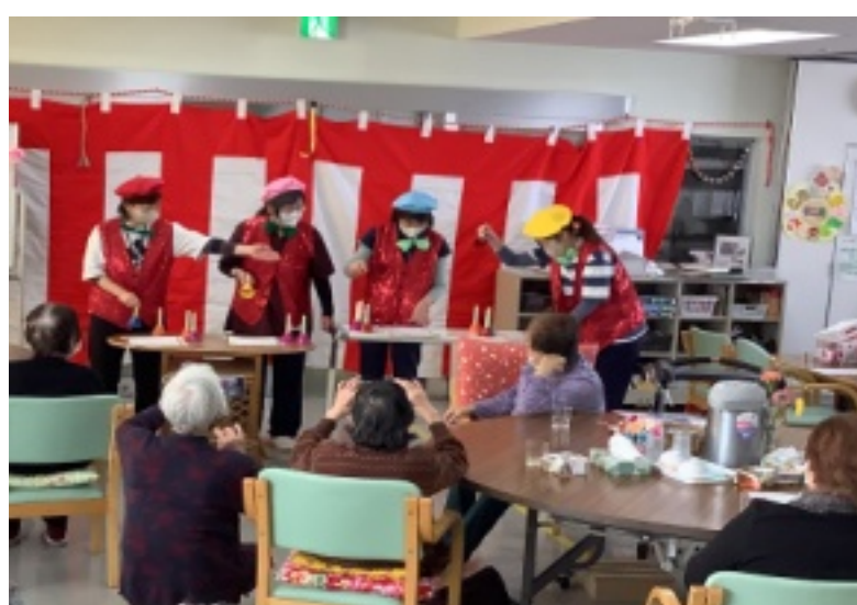
ハンドベルで「仰げば尊し」と「川の流れるように」を演奏