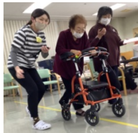
歩行の速度を測っています

2月17日(月)から21日(金)に、体力測定を行いました。歩行速度や握力など測定。ほとんどの方が維持できていますが、引き続き転倒に注意してほしいと思います。その為にも軽い運動を心がけましょう。