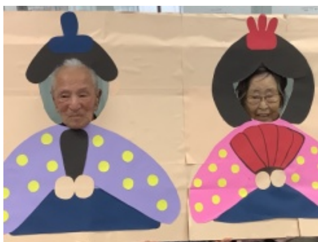
お二人ともに100歳!! 素晴らしい!

2月10日(月)から14日(金)には、3時のおやつでプリンアラモードを作りました。市販のプリンに果物や生クリームをのせて飾り付けました。「こんな風に食べると美味しいね」「これなら毎日でもいいね」と大好評。そのあとは、おひな様のパネルに顔をはめて写真を撮りました。