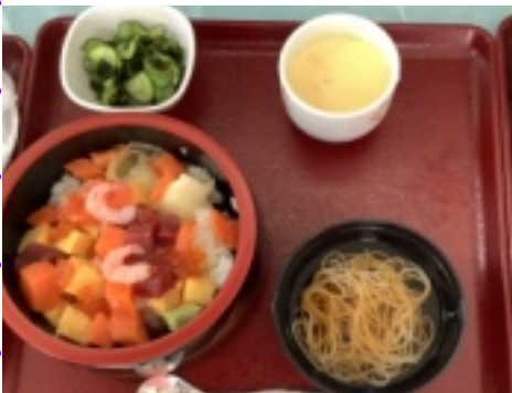
お祝い食は、生チラシと茶碗蒸し